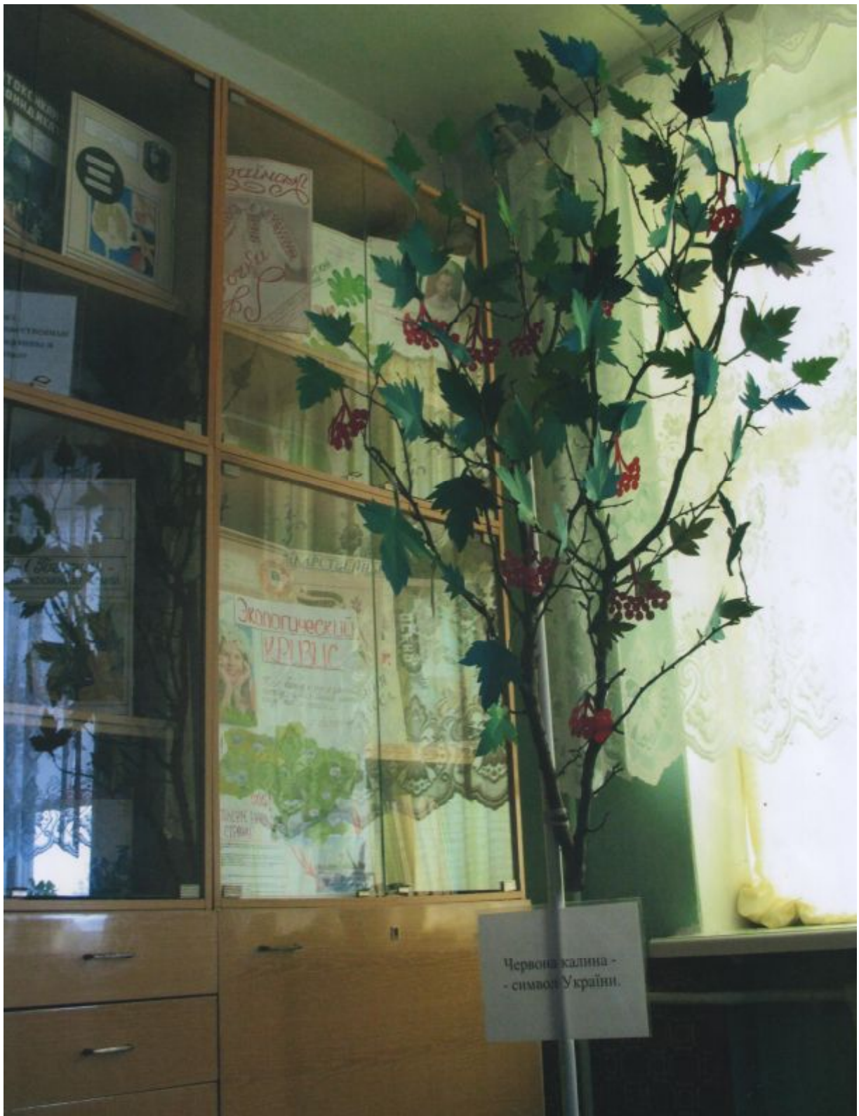
Червона калина - - символ України.