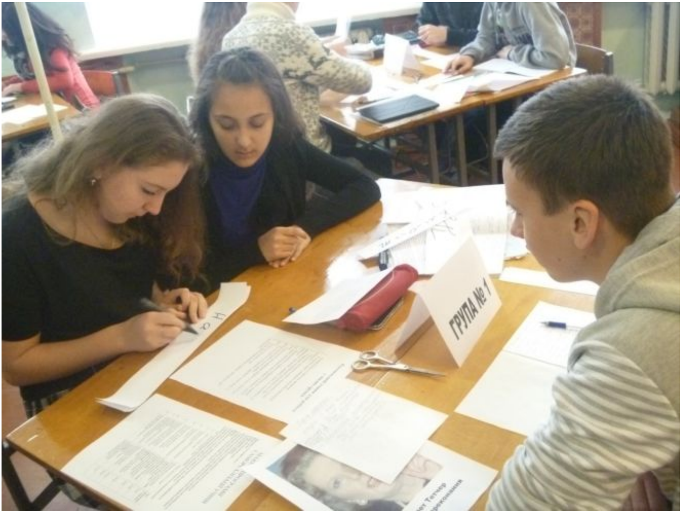
Розподіл обов'язків у групі №1