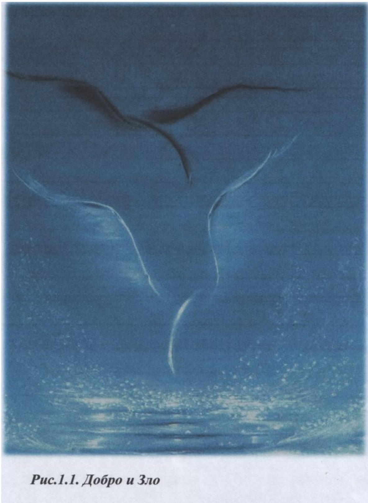
Рис.1.1. Добро и Зло

Поэтому актуальность бизнес-плана заключается в том, что он затрагивает жизненно важные вопросы современности: