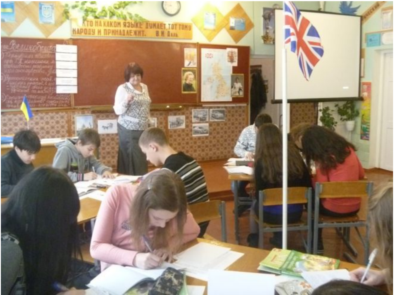
Організація групової роботи на уроці