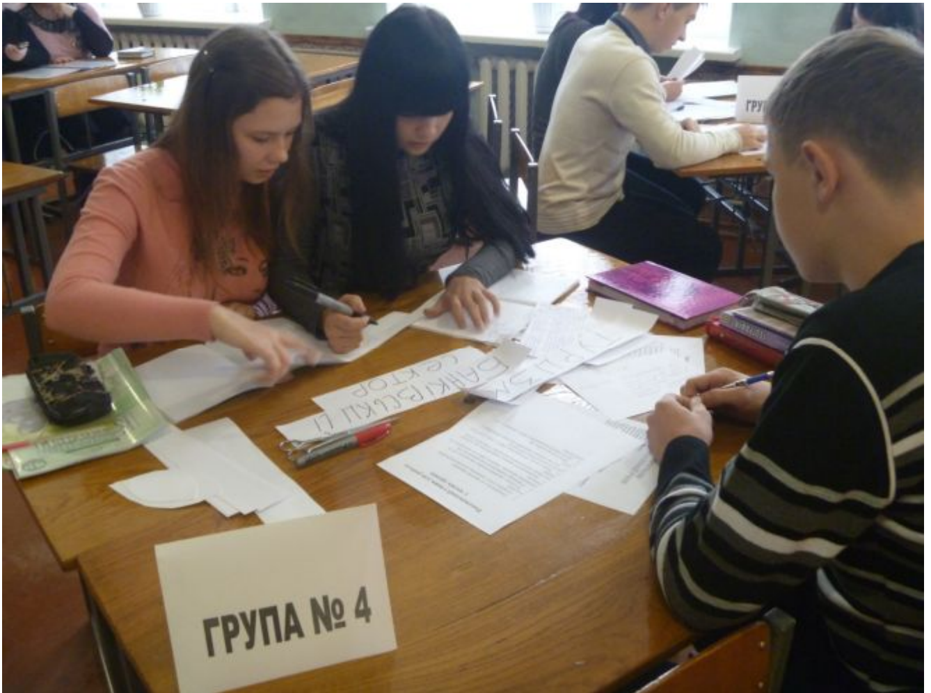
Робота над завданням у групі № 4