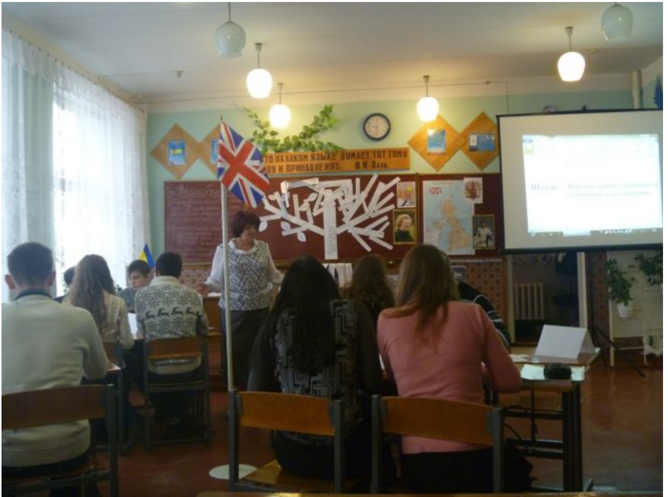
Підведення підсумків проектної групової роботи на уроці