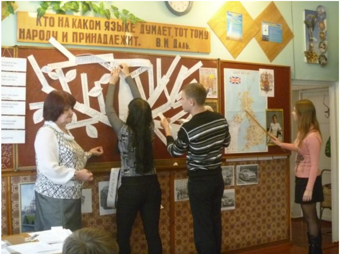
Презентація завдання групи № 3