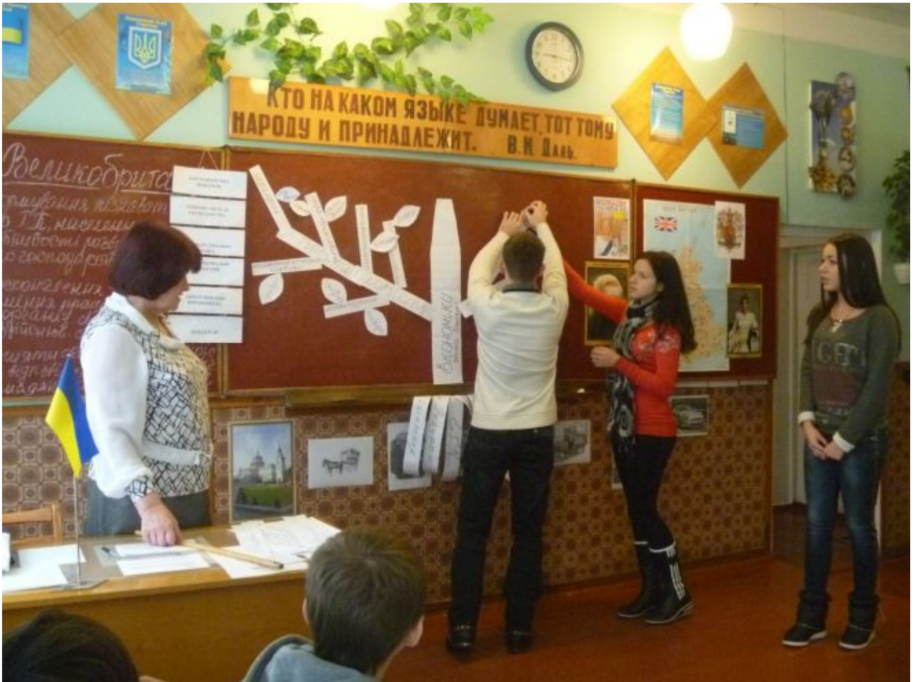
Презентація завдання групи № 2