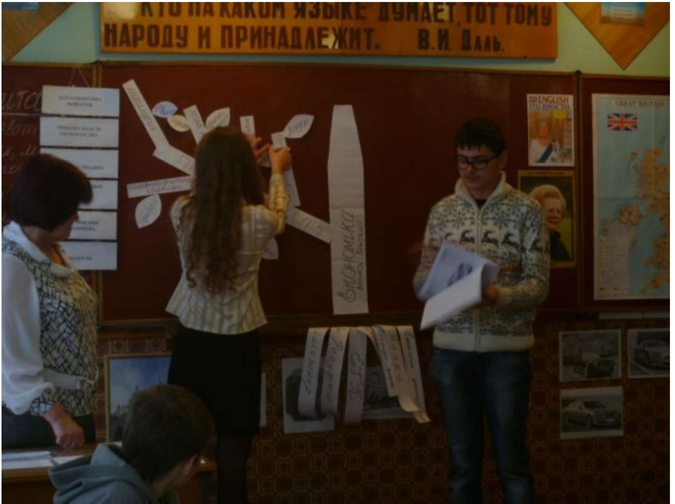
Презентація групової роботи