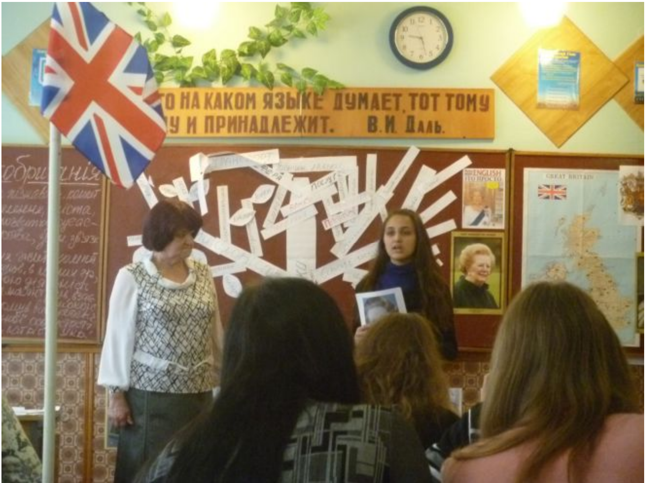
Доповідь представника групи № 1 про політику «тетчеризму»