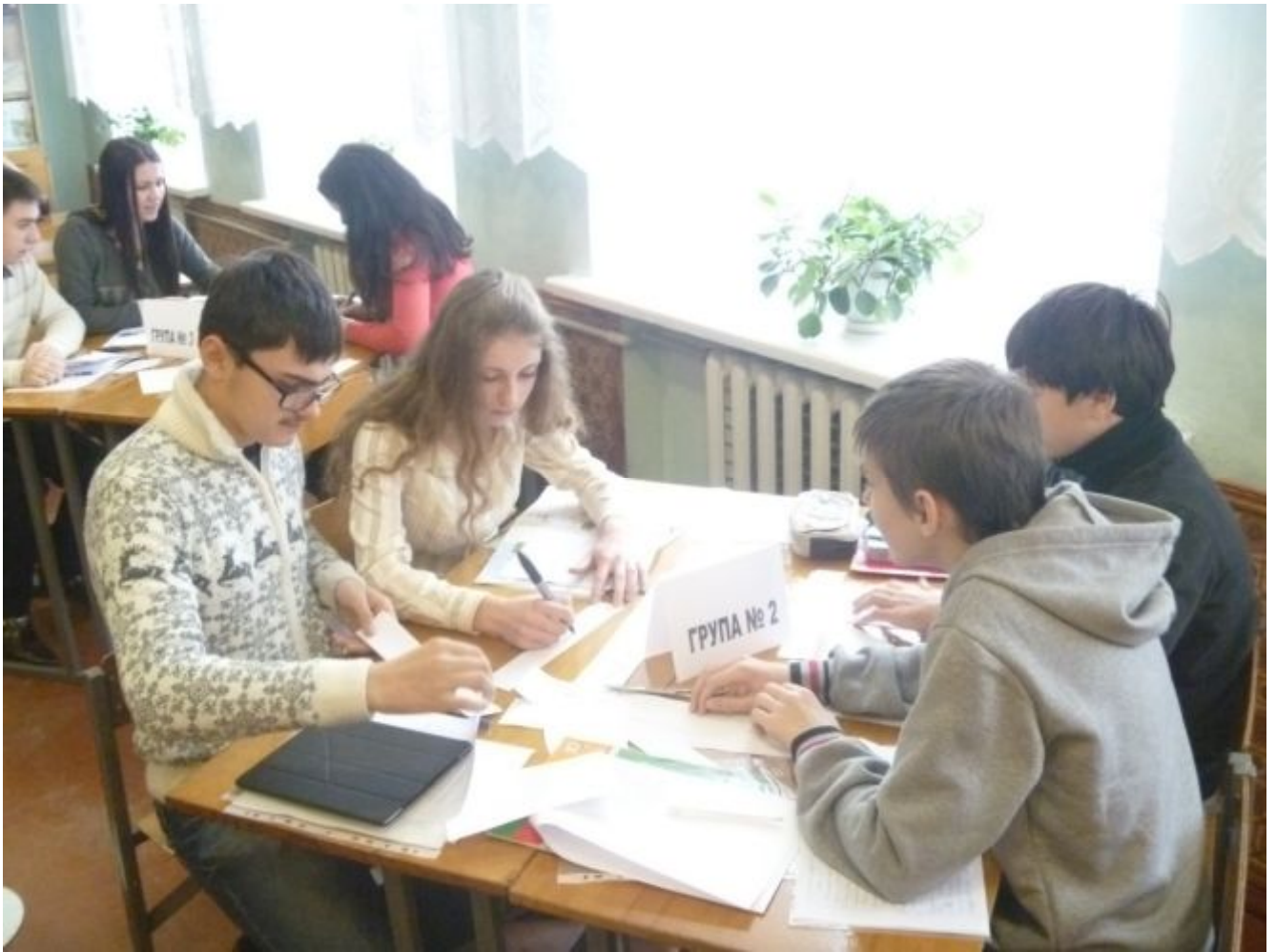
Завершальний етап роботи перед презентацією