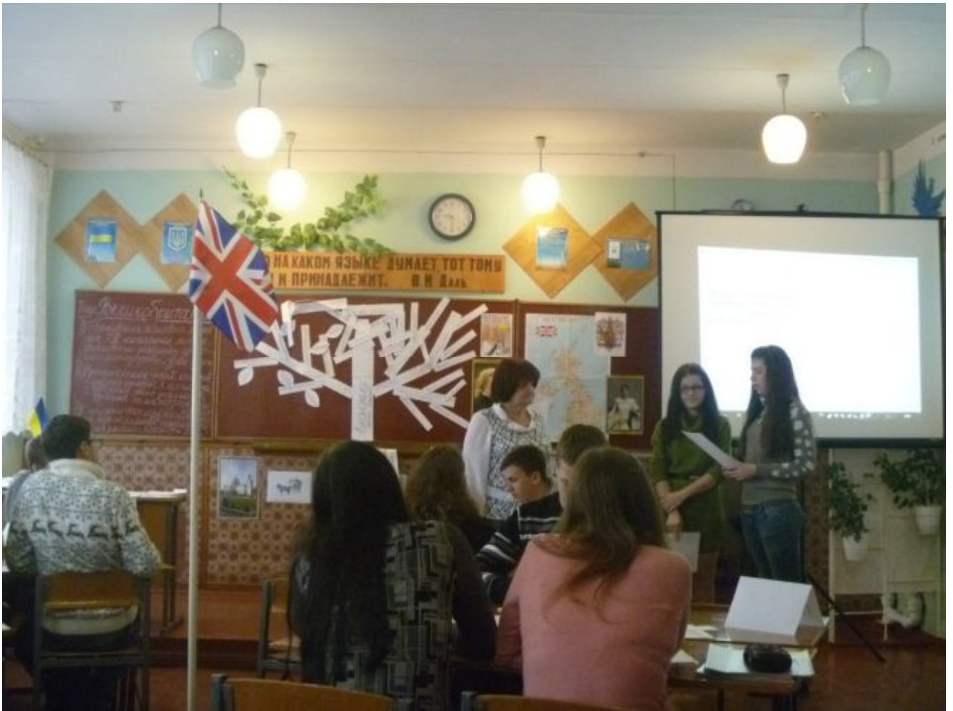
Виступ експертів і спостерігачів під час дебрифінгу