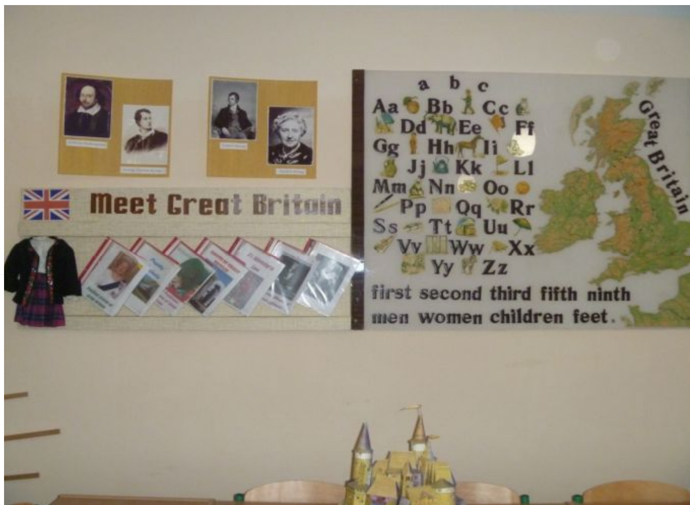
Додаток № 3