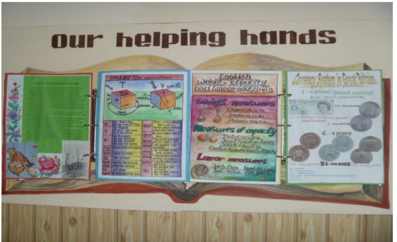
Додаток № 5