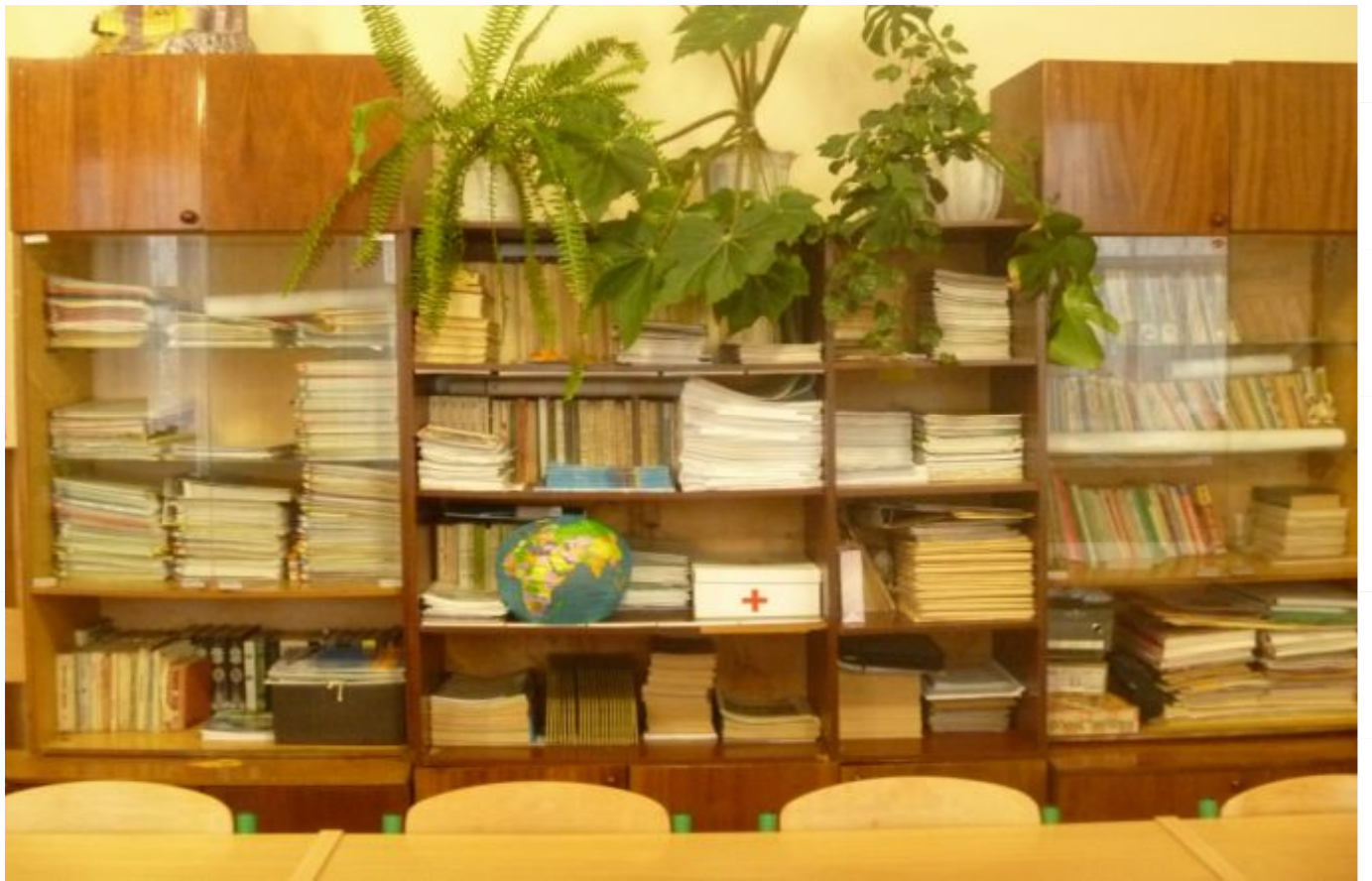
Додаток № 4