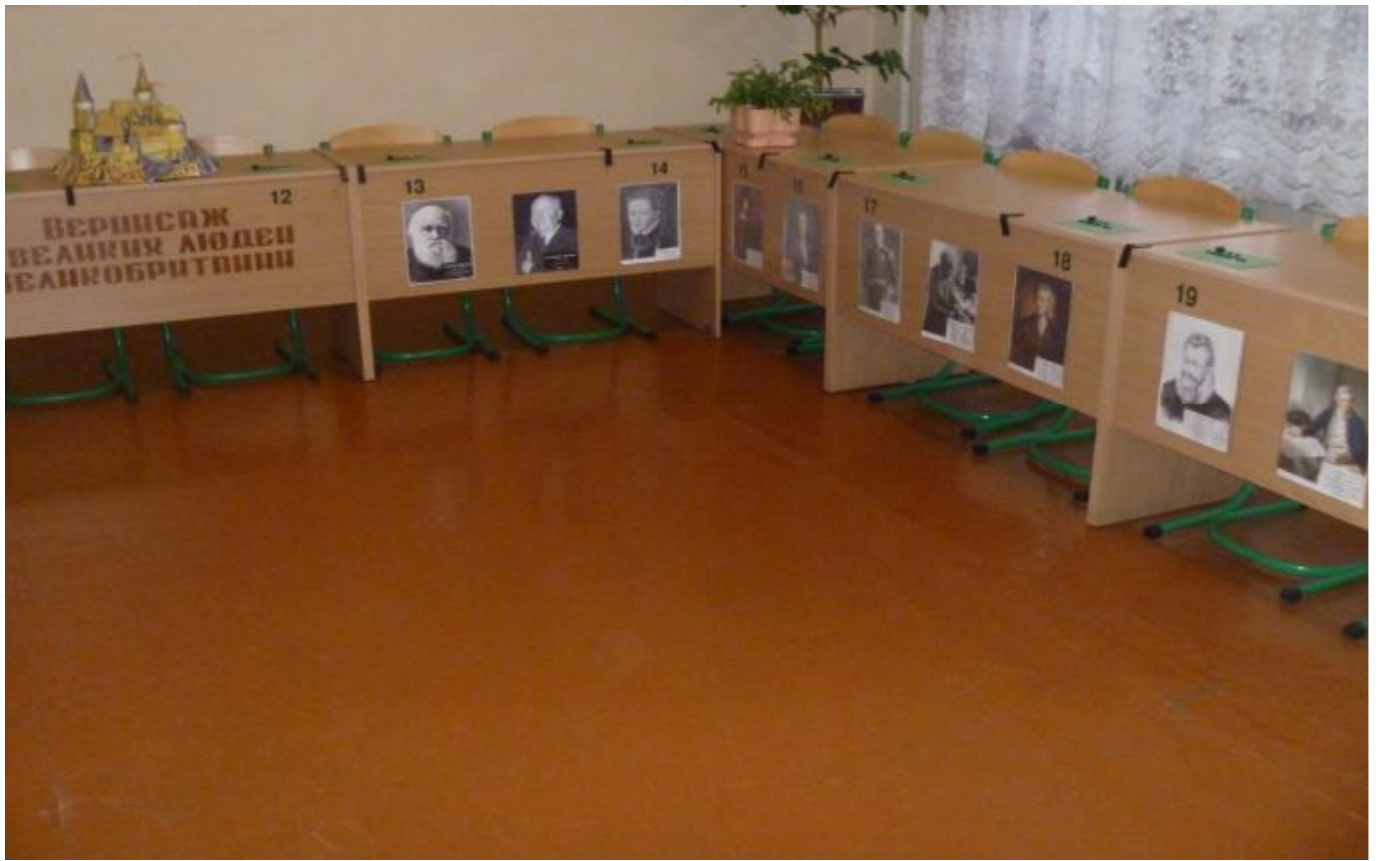
Додаток № 7