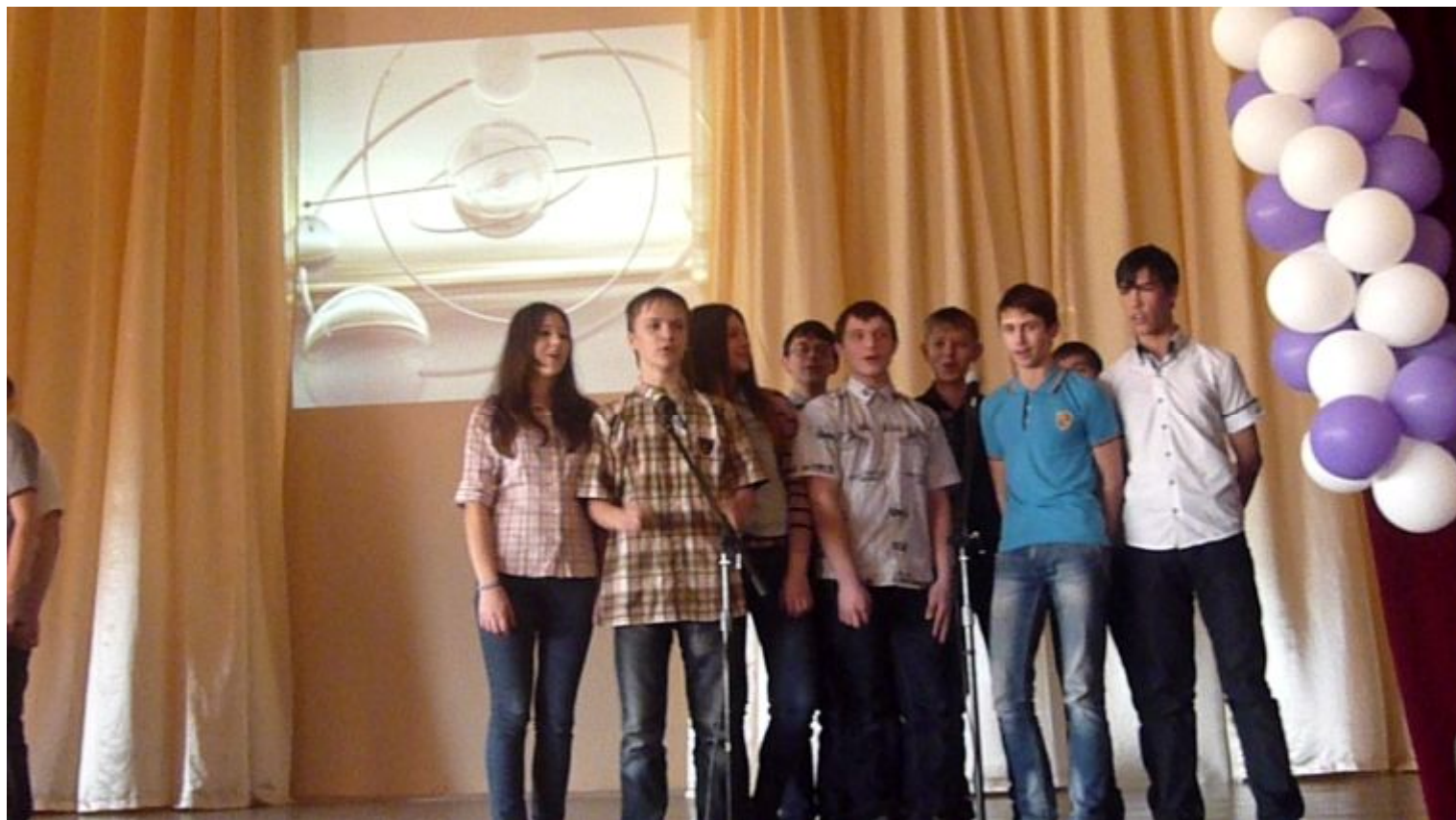
“Don’t worry, be happy” 10 – А класс