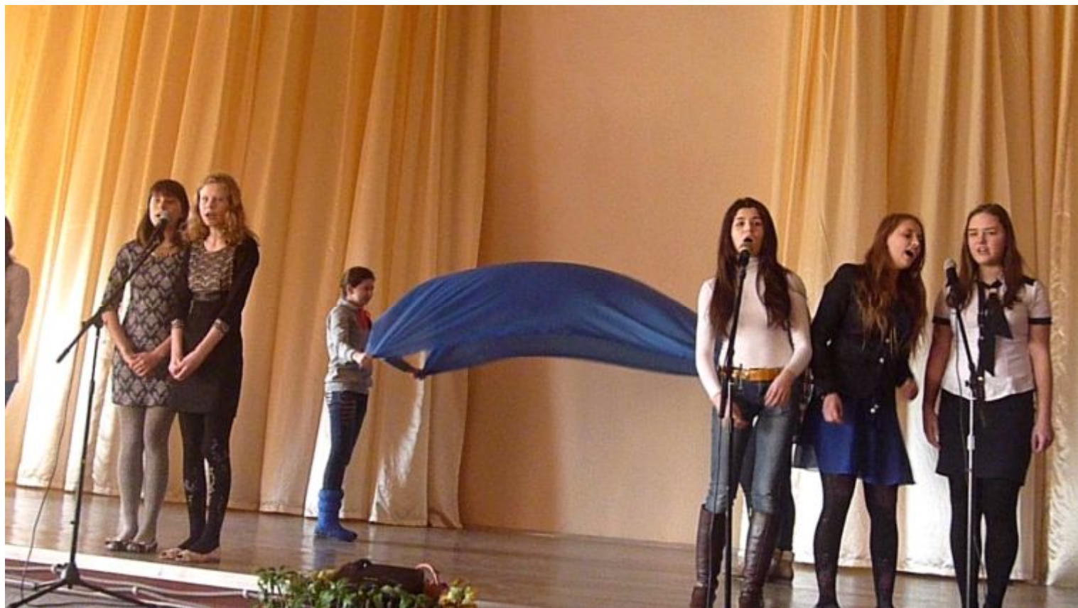
“Лауренция” 5 – А класс