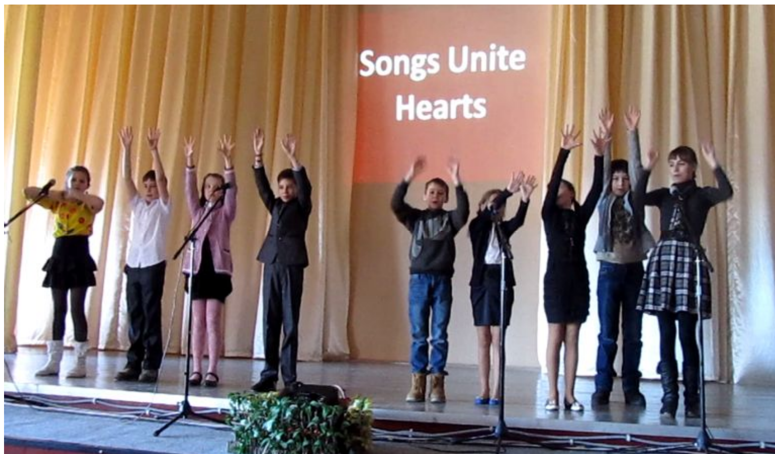
“If we are happy” 5- А класс