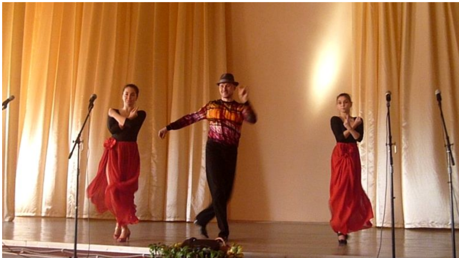
“Hit the road, Jack” 11 – Б класс