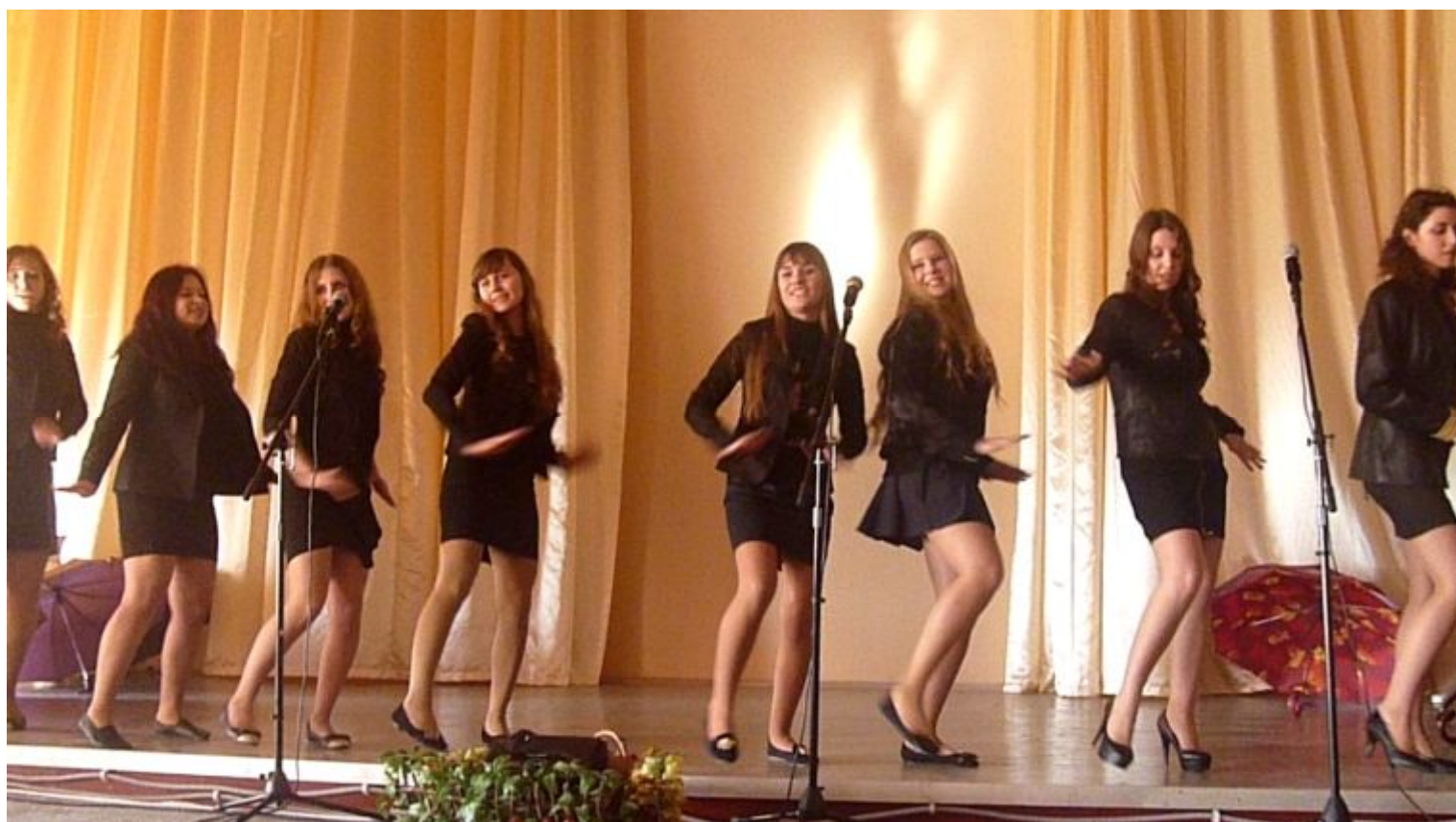
“Sweet Dreams” 11 – В класс