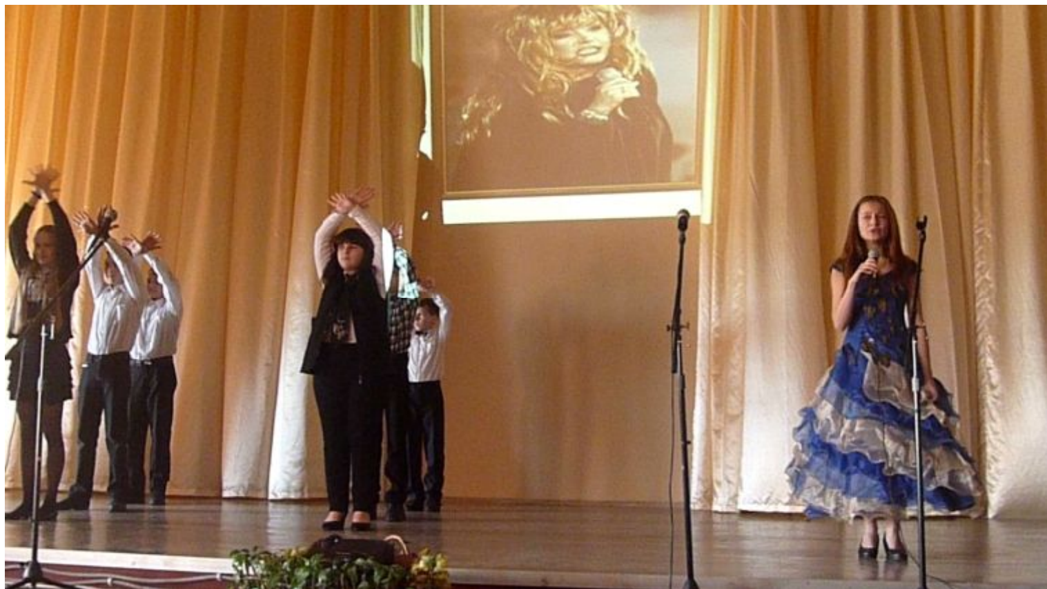
Цыганский танец - 6 – В класс