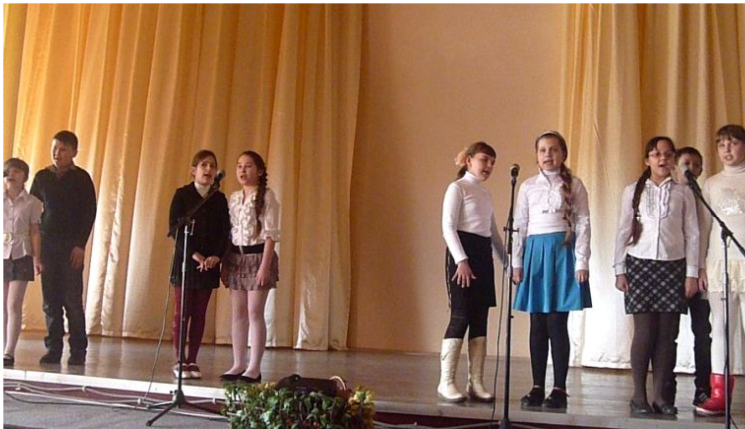
“Que Sera, Sera” 7 – В класс