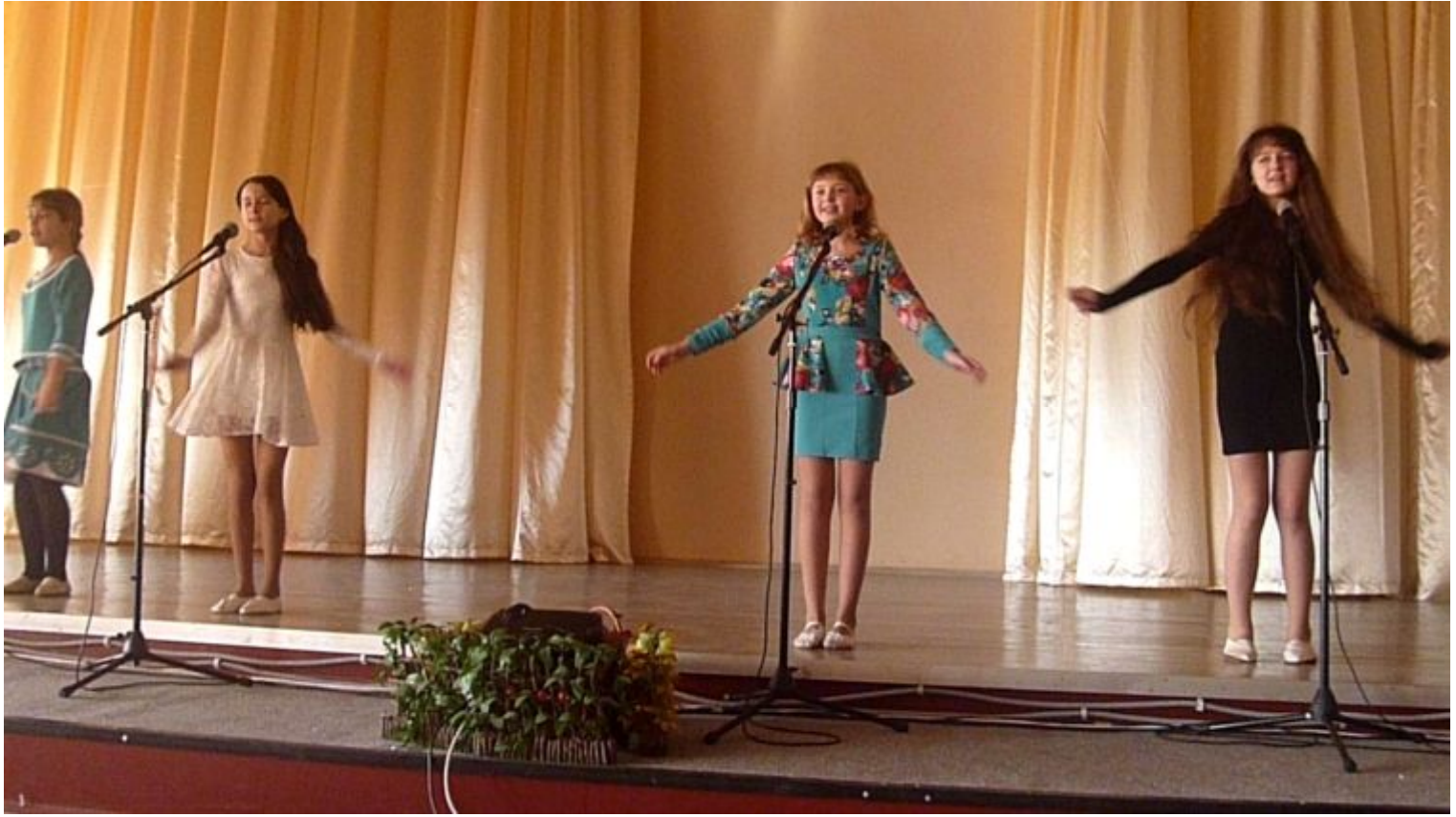
“Once upon in December” 10 – Б класс